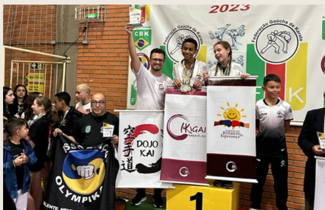
Troféu de 3º lugar do campeonato

Que volta, Senhoras e Senhores. Que volta! Definitivamente, 2023 está sendo um ano fantástico para os atletas da academia Dojokai.